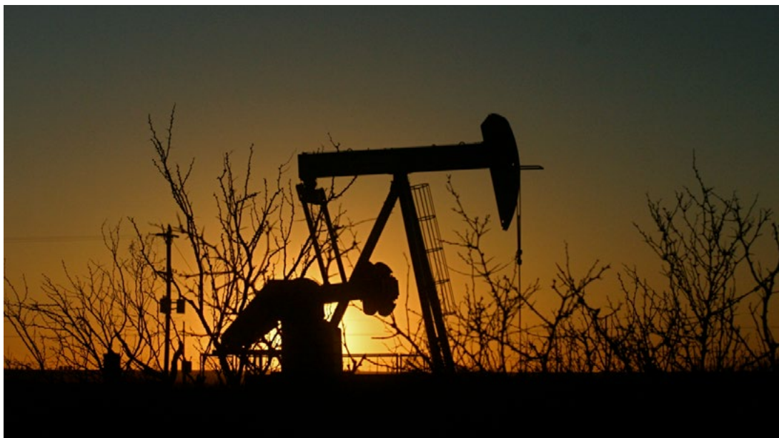
Permian Basin, foto ©Sharon Sperry Bloom, Flickr, CC BY-NC-ND 2.0

e investimenti che rischiano di stringere il cappio della prossima dipendenza fossile europea, compresa quella italiana, è quindi il gas del Permian Basin statunitense, prodotto in gran parte attraverso l'utilizzo di pratiche ultra-invasive come il fracking o la trivellazione orizzontale. Si stima che, fra il 2020 e il 2050, la combustione di tutte le riserve di petrolio e gas del Permian Basin possa produrre l'emissione di 46 miliardi di tonnellate di CO 2 .