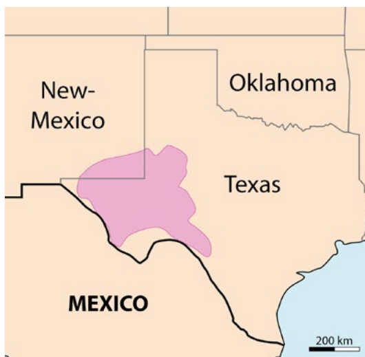
Emmanuel Roquette, CC BY-SA 4.0, wikimedia commons

In questo contesto, la finanza gioca un ruolo rilevante. È stata la finanza privata a guidarci nell'economia del petrolio, e ci sta trainando in quella del gas: non ha bandiere, fiuta un trend sul mercato e cerca di farlo diventare dominante,