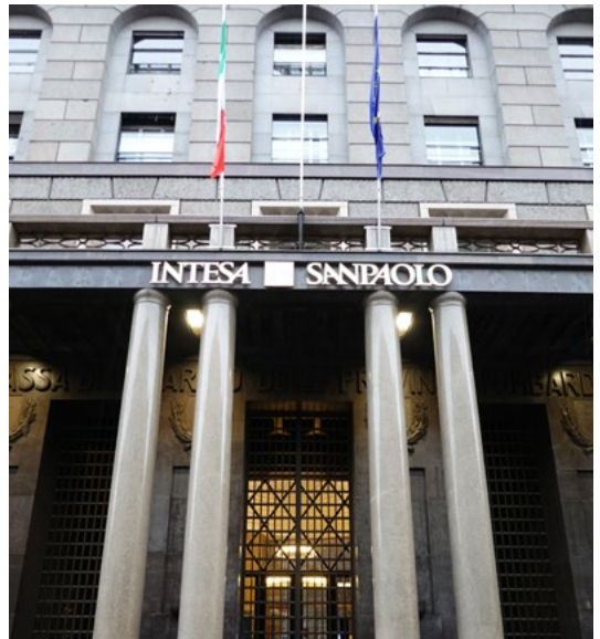
Gruppo Intesa Sanpaolo, Milano, foto Guilhem Vellut, flickr, CC BY 2.0

Tra il 2020 e il 2021, Intesa Sanpaolo ha finanziato i settori del carbone, del petrolio e del gas con 9 miliardi di dollari. Di questi, 6,4 miliardi nel solo 2021: un incremento del 146% rispetto all'anno precedente.