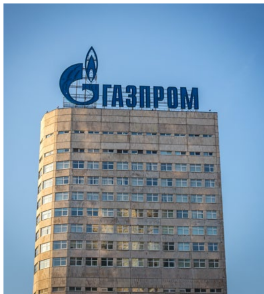
Gazprom, foto Thawt Hawthje, Flickr, CC BY 2.0.

dollari per il progetto Yamal LNG, sempre di Novatek 12 . L'esposizione finanziaria di Intesa verso le operazioni estrattive nell'Artico russo è opportunamente tutelata dalla banca nei suoi impegni per il clima e l'ambiente: la policy esclude infatti i finanziamenti a progetti estrattivi offshore nell'Artico, permettendo invece quelli sulla terraferma 13 , proprio come Yamal LNG e Arctic LNG-2.